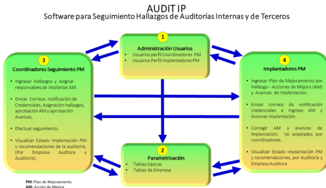
Figura 1: Módulos del software AUDIT IP