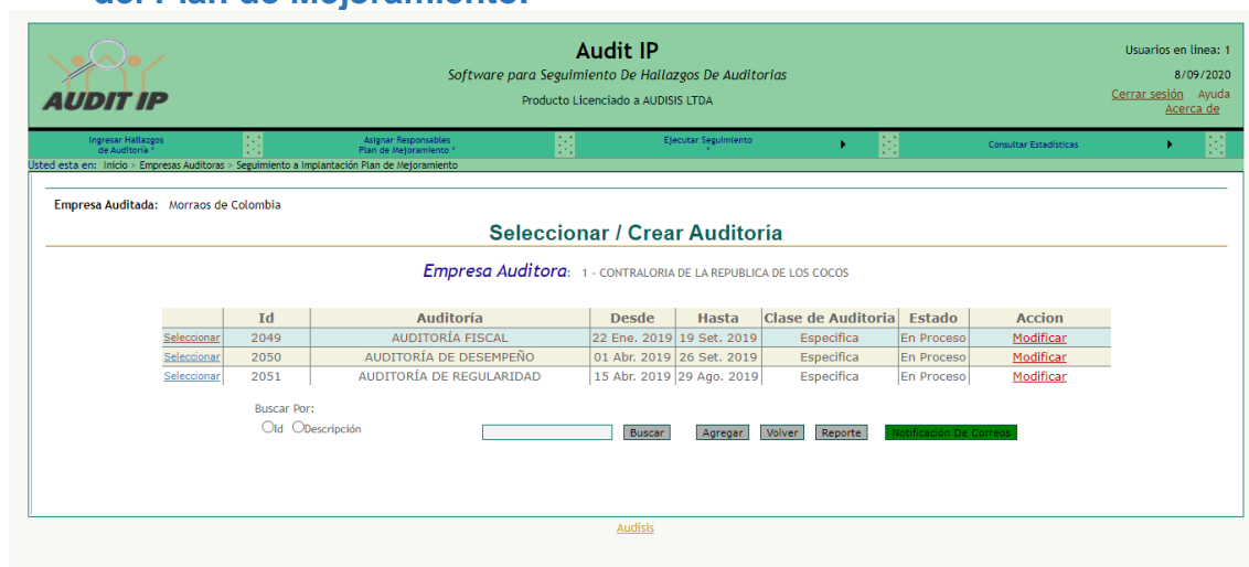
Figura 4: Menú de Planeación y Seguimiento del Plan de Mejoramiento por Auditoría.

Por cada auditoría, el software provee cuatro (4) opciones de menú para los usuarios Coordinadores de Seguimiento, con las cuales pueden ejecutar las siguientes actividades, por cada auditoría: