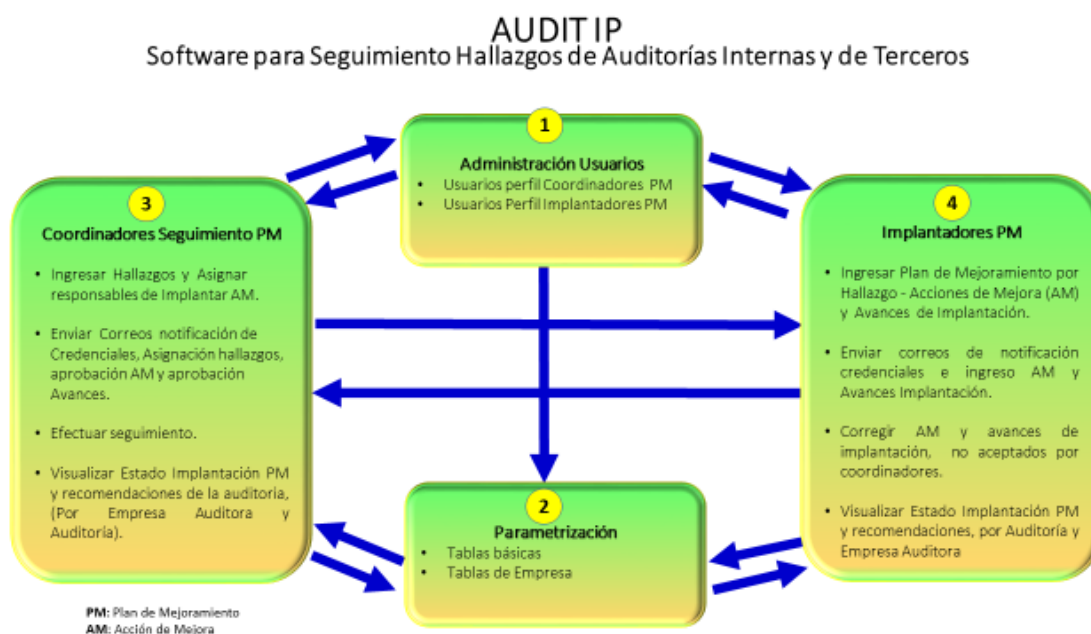
Figura 1: Módulos del software AUDIT IP

AUDIT- IP Web es una software para Gestionar la implantación de Planes de Mejoramiento Institucional y realizar seguimiento a los hallazgos, oportunidades de mejora y recomendaciones de auditorías realizadas a la Empresa por la Auditoría Interna y por terceros, como son las Firmas de Auditoría Externa (Auditores de Estados Financieros, Revisorías Fiscales, Auditoría de Sistemas, etc.), Organismos de control y vigilancia del Estado (Contralorías, Superintendencias, Ministerios), Auditorías Internas a sistemas de gestión realizadas por personal de la empresa o terceros (ISO 9001, ISO 14000, de salud ocupacional, ISO27001, ISO 22301, etc.) y Auditorías externas realizadas para fines de certificación de Sistemas de Gestión.